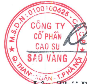
Lâm Thái Dương